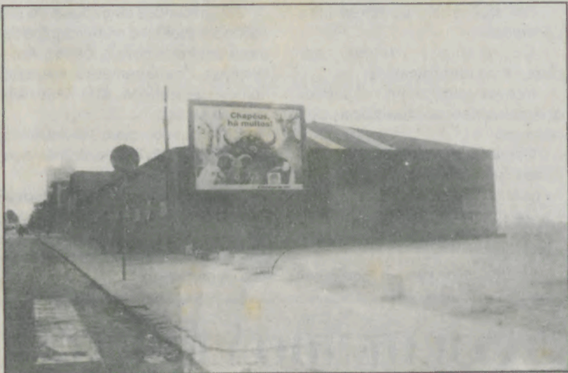
O Folhetas Astória foi enriquecido com um cartaz de chifrudos. Mais uma valorização turística da cidade.