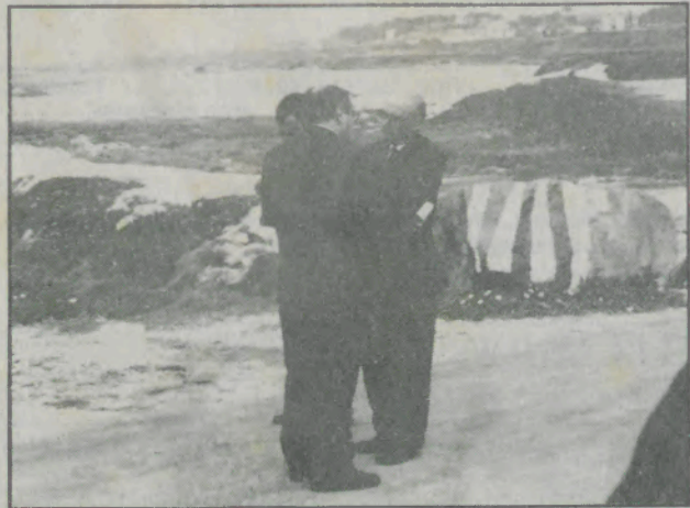
O Presidente da Câmara em amena conversa com o director do «Defesa de Espinho» enquanto aguardavam a chegada do Primeiro Ministro.