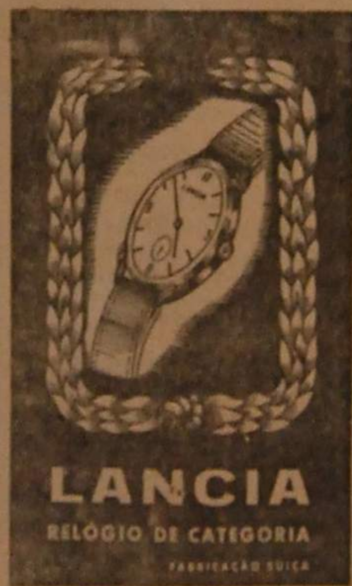
LANCIA RELOGIO DE CATEGORIA FABRICAÇÃO SUICA

e de luto executa rapidamente a Tipografia Espinhense