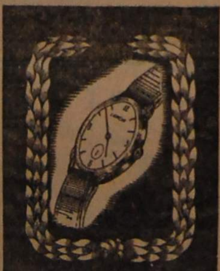
LANCIA RELÓGIO DE CATEGORIA FABRICAÇÃO SUÍÇA