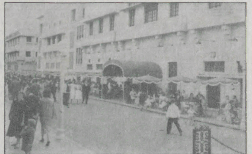
Um aspecto da avenida nos anos 60.

Para que é que existem a cabine sonora fechada e os quiosques que