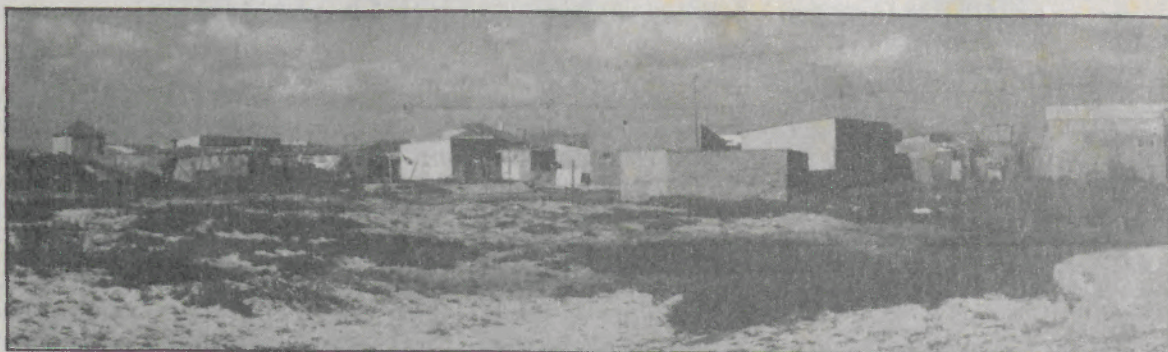
Aspecto parcial do casario da praia de Paramos construído à balda mais do que nunca sujeito à destruição pelo mar em fúria.

tinua a ser executado o projecto de nova intervenção de defesa na orla marítima espinhense para ser posto em execução o mais depressa possível.