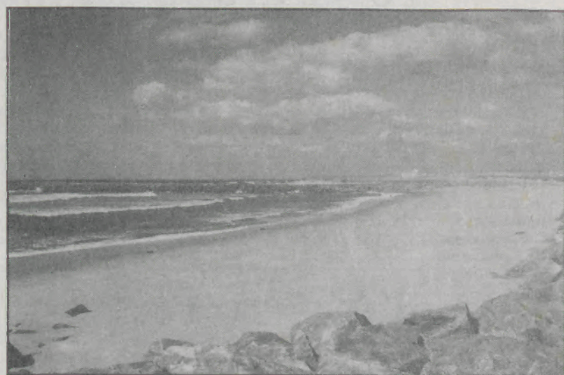
Com Espinho lá ao fundo a praia de Paramos corre o risco de ser destruída pelo mar se não forem tomadas providências urgentes e sérias.