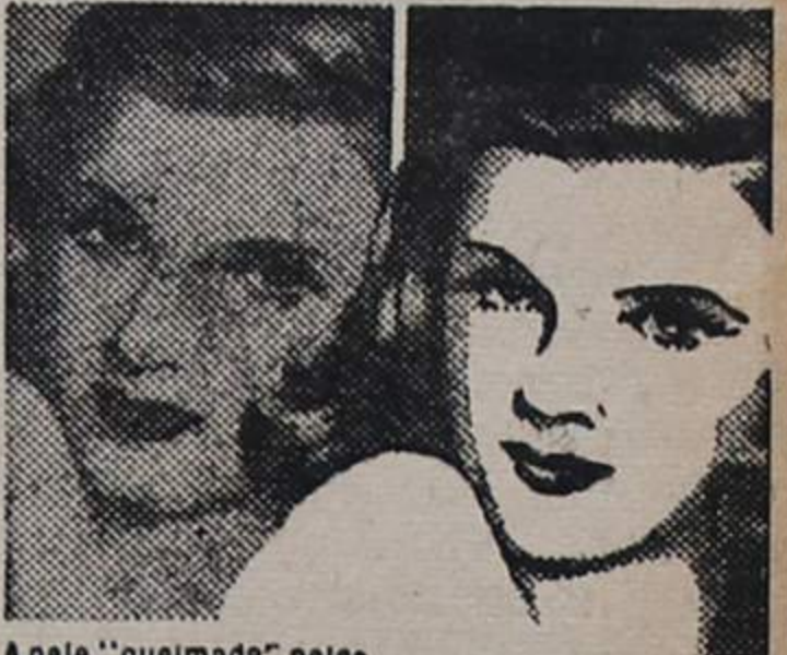
A pele "queimada" pelas intempéries e pelo sol perde a sua cor natural e deseca-se. Teia como esta cera de flores dá uma tez duma alvura romântica e duma doçura irresistível.

O coração das flores raras que crescem na Côte d'Azur engerra uma cera virgem extraordinária para embelezar a epiderme. Destilada e vendida sob a forma prática dum creme e sob o nome de Cire Aseptine, ela tem realmente sobre a tez um poder mágico. De manhã e à noite, aplique um pouco desta Cire Aseptine e veja como a pele, a mais estragada pelas intempéries ou pelo sol, se renova literalmente porque as células da pele "queimadas" dão lugar a células novas, todas brancas e admiravelmente suaves ao tacto. A maior parte das vezes 3 dias são suficientes para aclarar a tez de um ou dois tons e para a amaciar. Desde a primeira aplicação, a transformação é surpreendente: a tez começa a tomar aquela alvura romântica à qual nenhum homem pode resistir. Os pontos negros tão feios e os poros dilatados apagam-se à oitos vistos e mesmo as sardas acabam por desaparecer. Empregue a Cire Aseptine igualmente sobre os ombros, o pescoço, os braços e as mãos. Cire Aseptine nas perfumarias e farmácias.