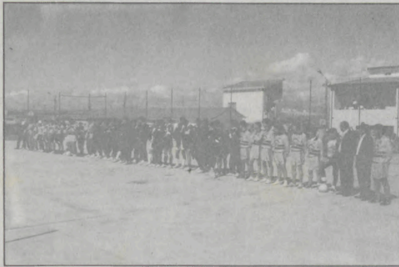
As equipas que estiveram presentes na inauguração.