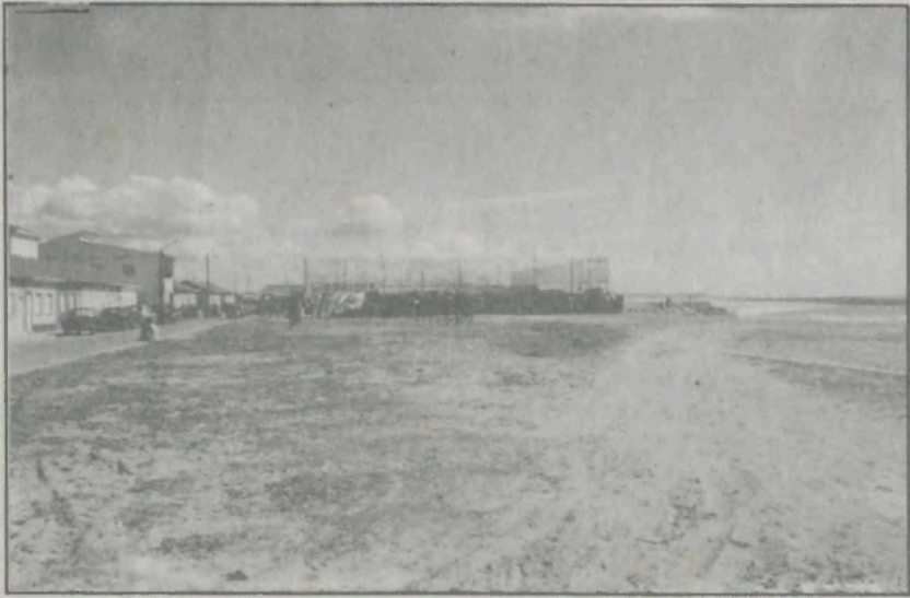
O Recinto da Marinha entre o Bairro e a praia.