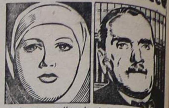
Pode uma mulher de 50 anos ter uma tez tão clara como a que captou a segredos da juventude?