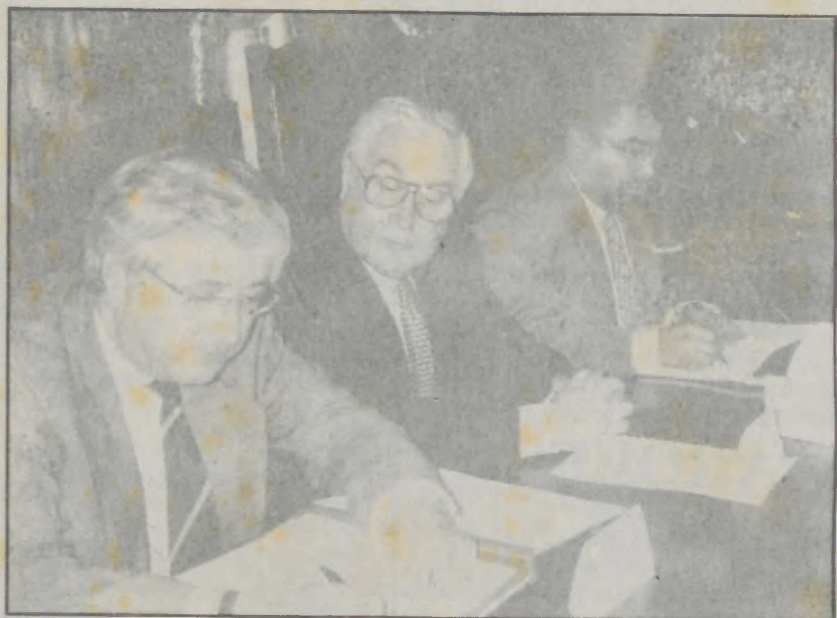
O Ministro Falcão e Cunha ao centro testemunha a assinatura do protocolo.

A melhor e mais adequada integração social dos mais desfavorecidos do concelho vai ser implementada depois do Ministro do Emprego e Segurança Social Falcão e Cunha ter avalizado o protocolo entre o