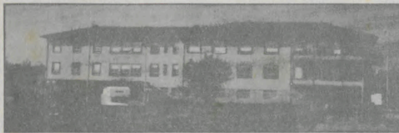
As obras de remodelação no Hospital de Espinho estão prontas e já foi retomada a actividade cirúrgica, no novo bloco operatório e áreas adjacentes.