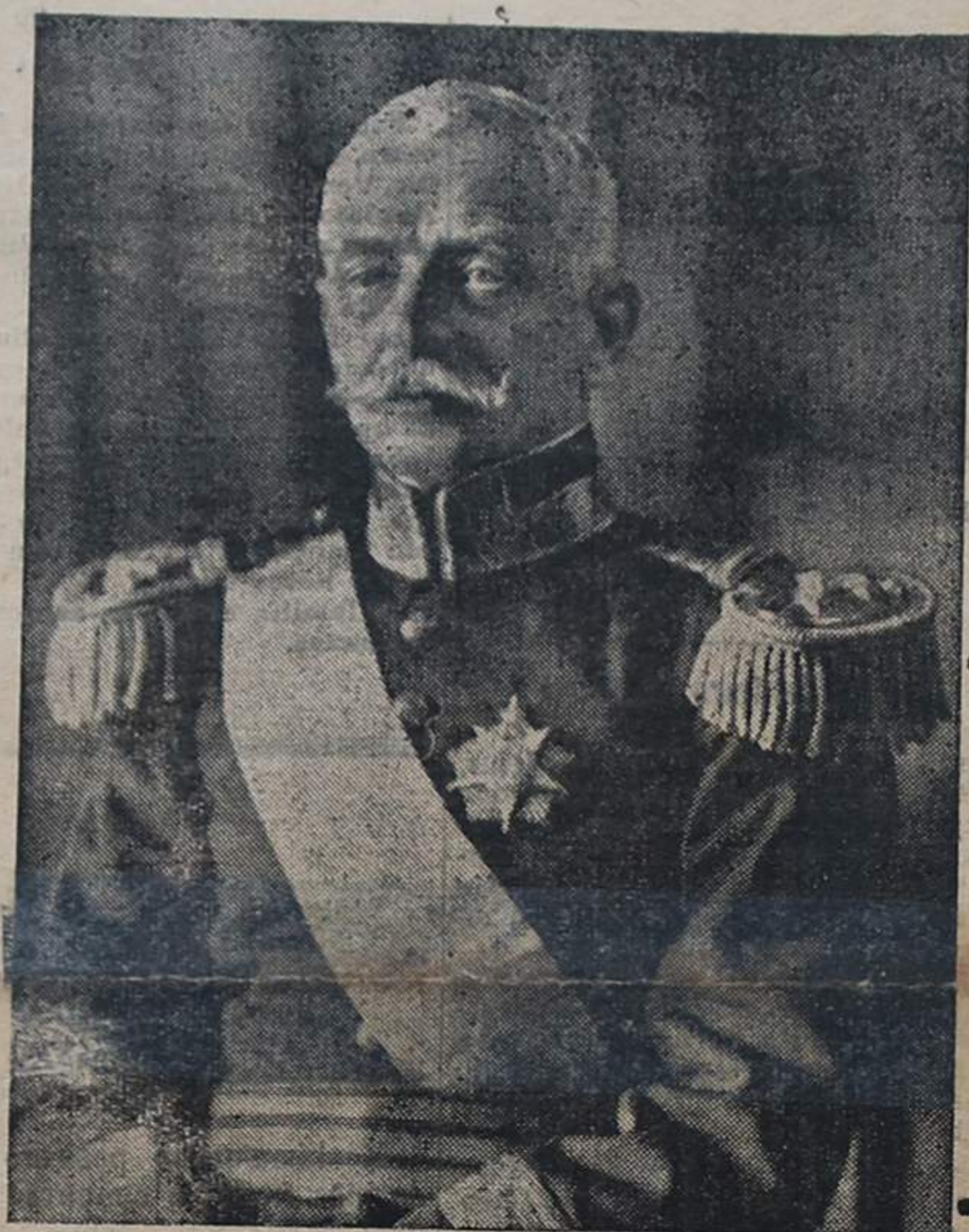
MARÉCHAL ANTÓNIO OSCAR DE FRAGOSO CARMONA

E' do seguinte teor a Ordem do Exército que elevou o sr. general Carmona ao marechalato: