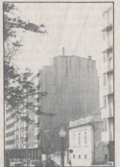
O Centro de Saúde de Espinho em conflito com a Ordem dos Médicos

Possivelmente no próximo ano será a vez de vender o prédio e terreno onde está a funcionar o Centro de Saúde, o que poderá render um milhão, para custear parte das despesas com novas acessibilidades projectadas para o concelho.