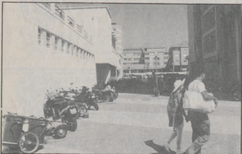
O passeio entre a Piscina e o hotel Praia Golfe cedido para parque privativo deste.

A sentença será lida no dia 29 de Junho às 9h30.