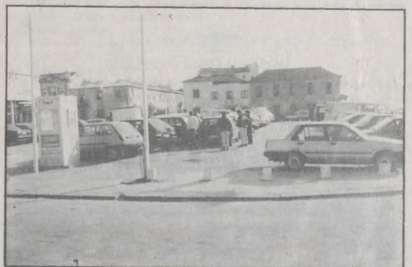
O parque de estacionamento cedido aos dois clubes.

Os casos foram várias vezes tratados nas reuniões da Câmara