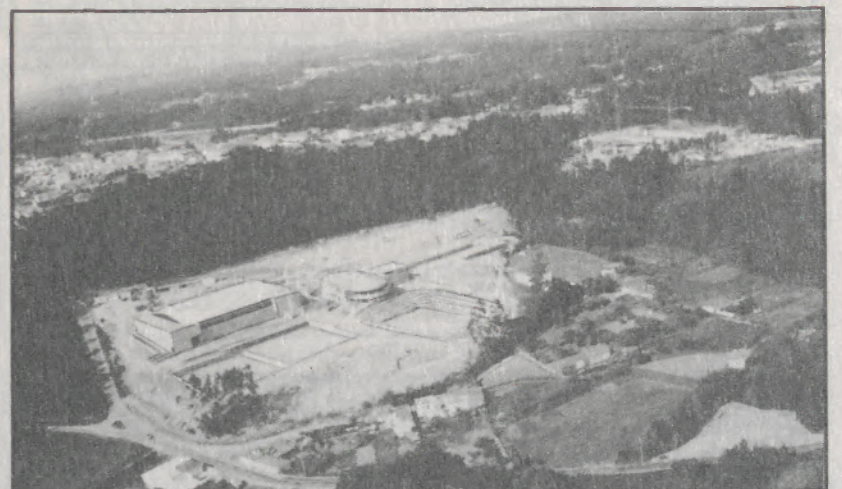
Continuam em bom ritmo as obras do Complexo de Ténis (em primeiro plano) e da Nave Desportiva (em cima à direita) em curso no Parque da Cidade.