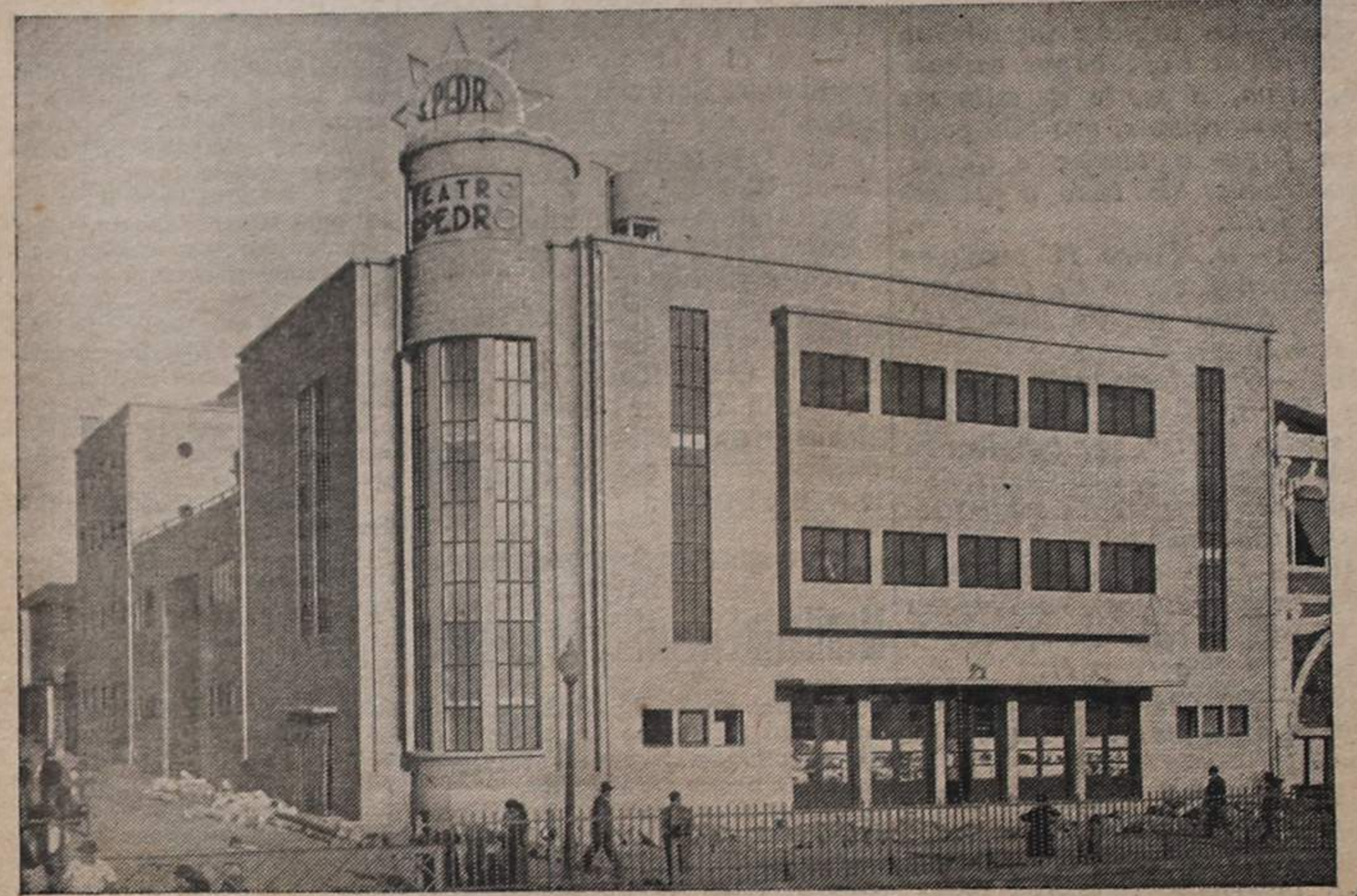
A nova e magestosa casa de espectáculos de Espinho que acaba de ser inaugurada e representa mais um título de orgulho para os Espinhenses