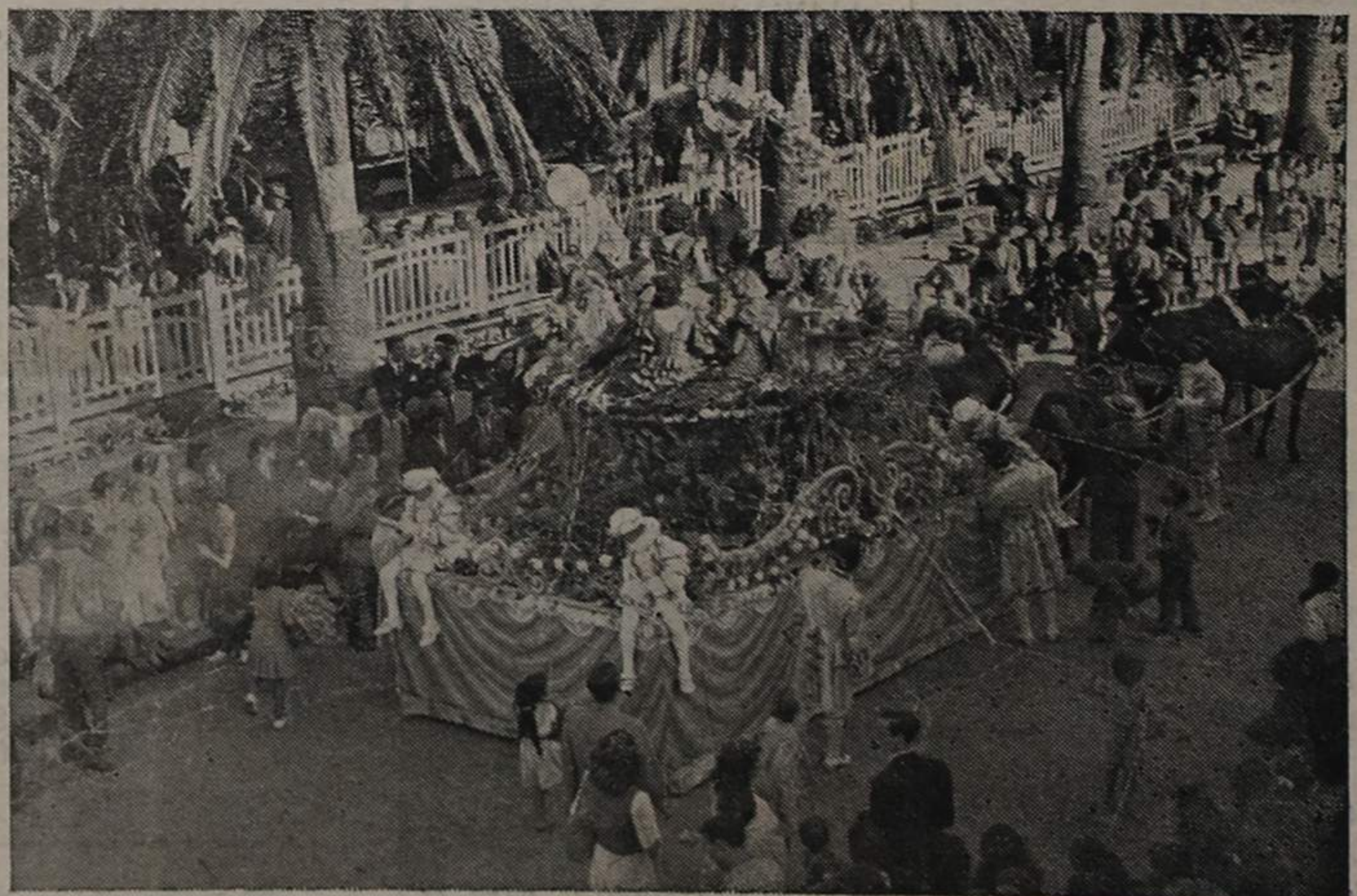
O magestoso carro estilo Luis XV, apresentado pelo Grande Casino de Espinho e que obteve o 1.º prémio

CANCELA J.ºr Enfermeiro diplomado RUA 16 N.º 445 ESPINHO Telefone 361—E