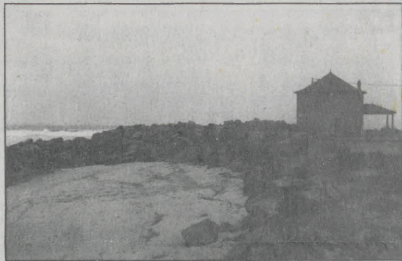
Capela de S. João continua à mercê das ondas.

A praia frente à piscina perde areal e o esporão da praia da Baía continua a desmantelar-se na cabeça com a violência das vagas.