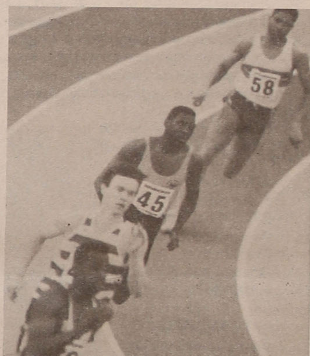
Mais de trinta canais com uma oferta variada, onde não falta o cinema e o desporto

ESPECIALIDADE EM CAFÉ FÁBRICA DE TORREFAÇÃO PRÓPRIA GRANDE SORTIDO DE BEBIDAS NACIONAIS E ESTRANGEIRAS