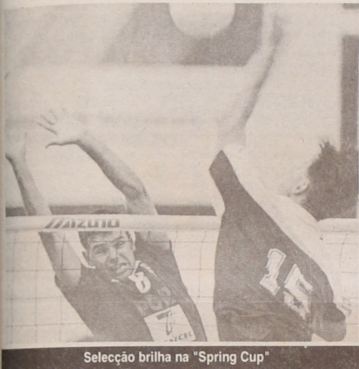
Seleção brilha na "Spring Cup"

Com efeito, os campeões nacionais vão até Clearwater, na Flórida (EUA), disputar a segunda etapa do Circuito Mundial de Voleibol de Praia, não jogando por tal motivo a fase final da "Spring Cup", mas regressando a Portugal a tempo de integrarem a selecção que vai disputar a "poule" de qualificação para a fase final do Campeonato da Europa, juntamente com Croácia, Finlândia e Letónia.