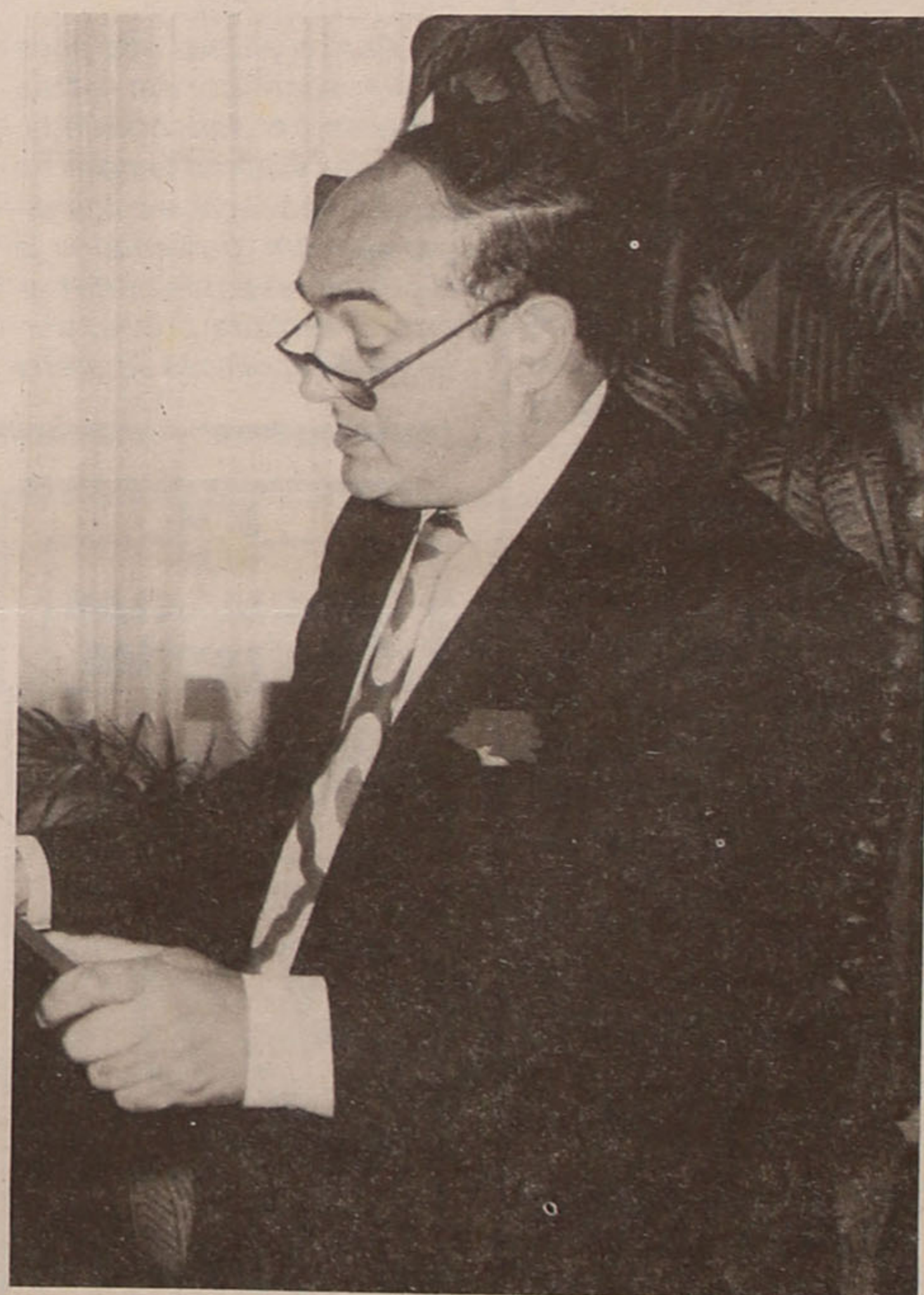
"Estas saudações são provincianas"