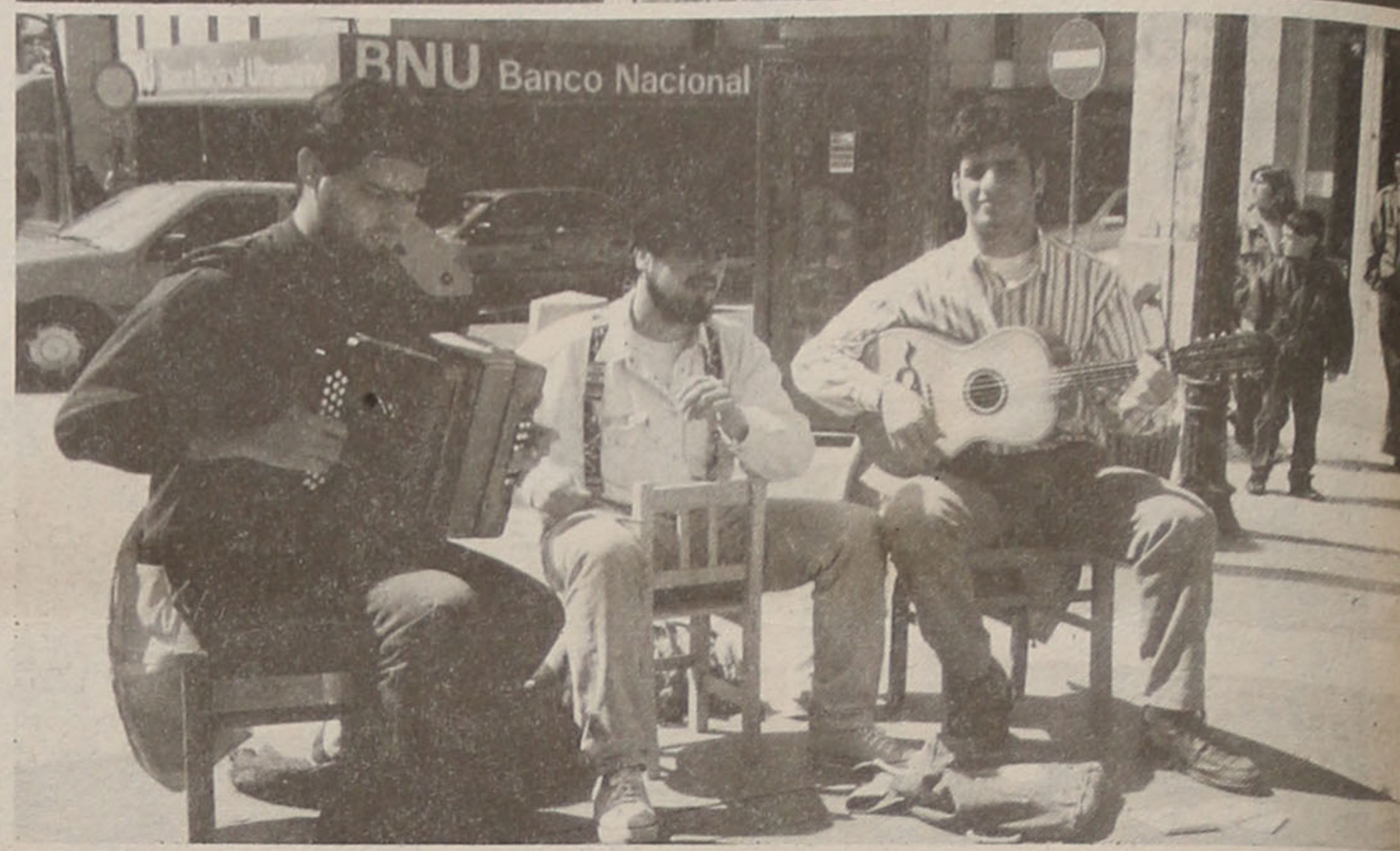
Das exposições à música na rua, o Abril em festa

bater a prepotência, o clientelismo ou a subserviência. São certamente estas atitudes que o 25 de Abril consagra na sua mensagem de liberdade, e que levam a Assembleia Municipal de Espinho a manifestar a sua confiança nos ideais democráticos e na esperança de que é possível construir uma sociedade mais justa, mais livre e mais fraterna".