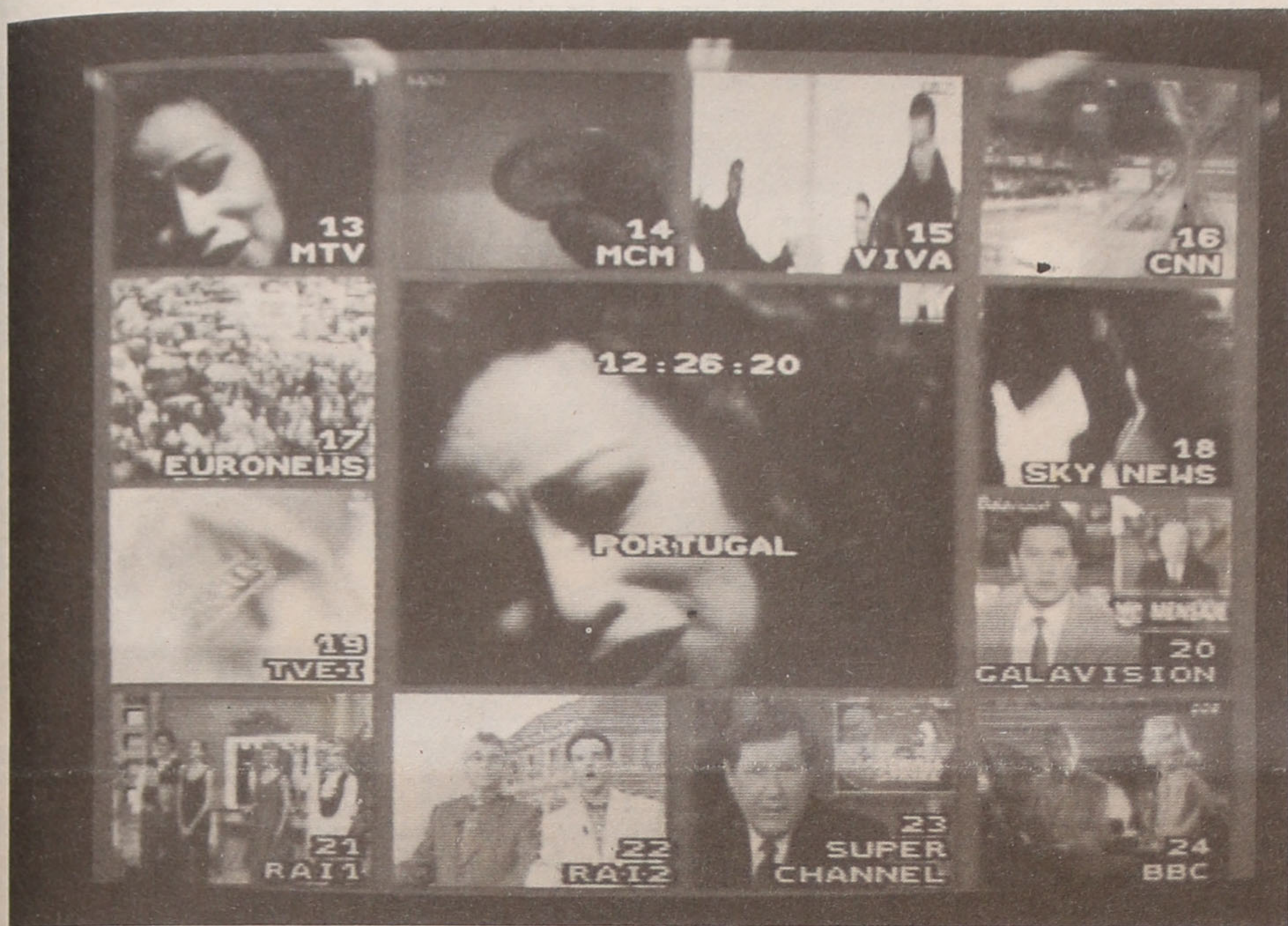
Mais de trinta canais já servem parte do Grande Porto