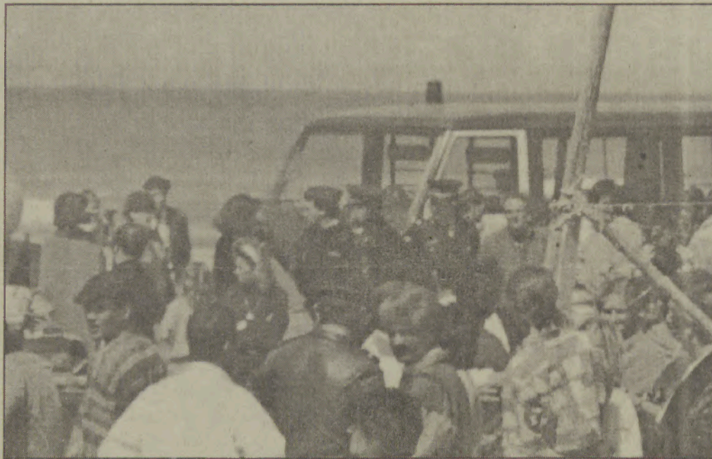
A missão dos agentes da Polícia de Segurança Pública é, deve ser, mesmo a Segurança Pública e não a de privados.

Todavia a nenhuma das perguntas feitas o Comandante Costa se furtou, o que demonstra que os seus receios eram infundados.