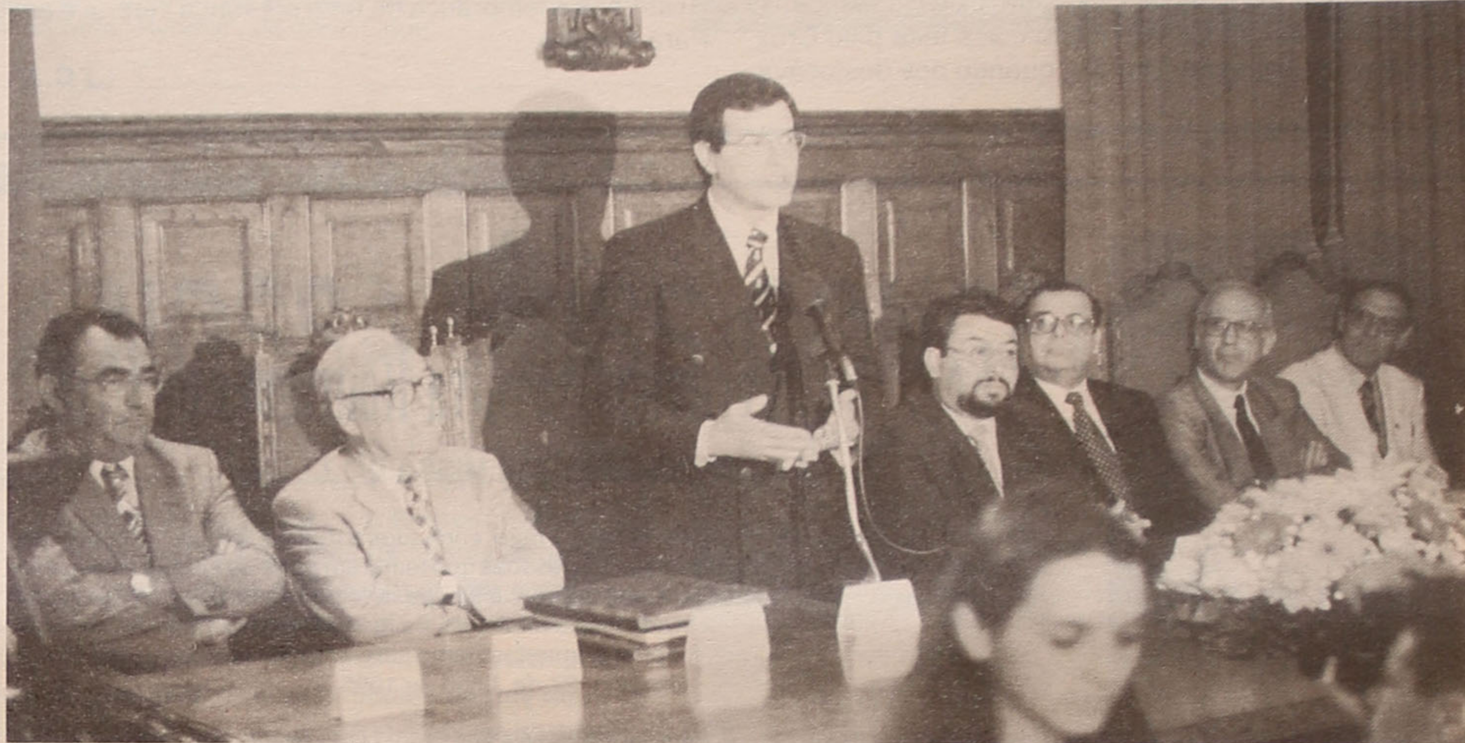
O Secretário de Estado da Educação e Desporto reiterou a necessidade de uma substancial melhoria na qualidade do ensino