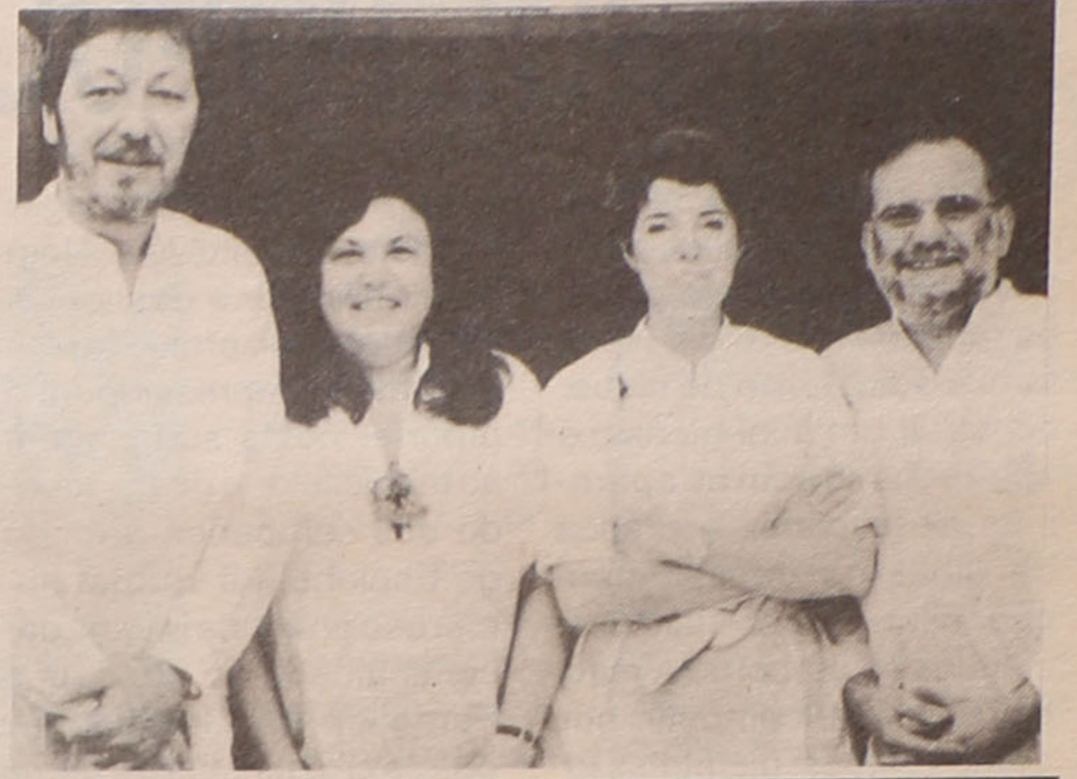
"Opus Ensemble" actuam esta noite no Cine-Teatro S. Pedro