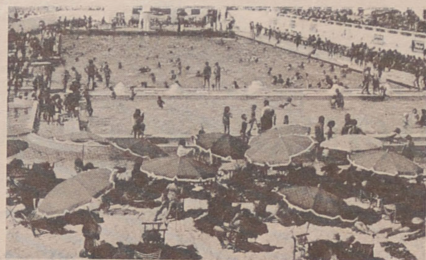
Renovação da Piscina vai começar