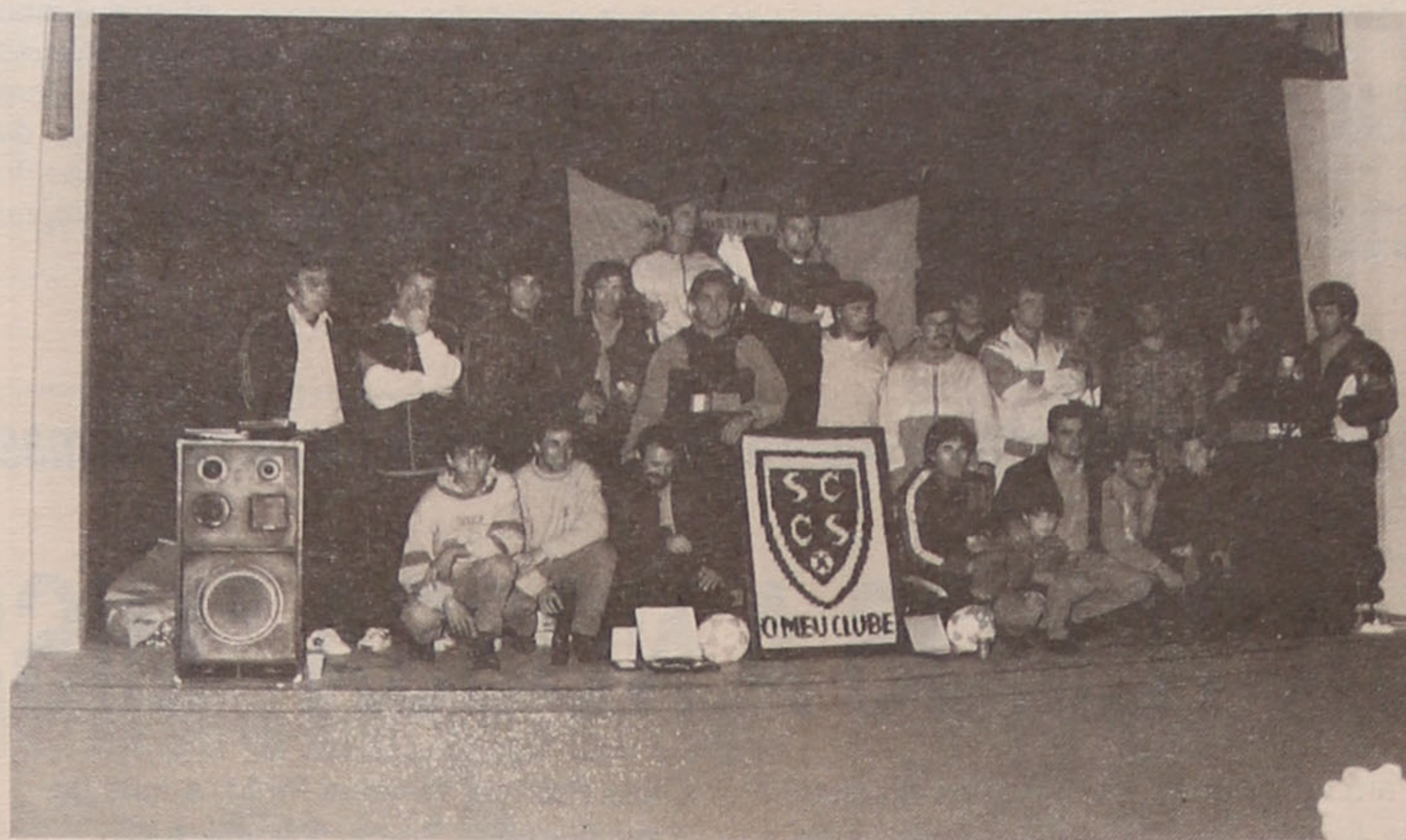
Cruzeiristas na festa do 39.º aniversário, no último dia 22 de Abril

AR: Sobrevivemos das quotas dos sócios pagantes (que andam à volta dos 60) e dos donativos dos amigos do clube. Este pequeno bafão de Freguesia, que aqui temos constituído, atualmente, a nossa principal fonte de receitas.