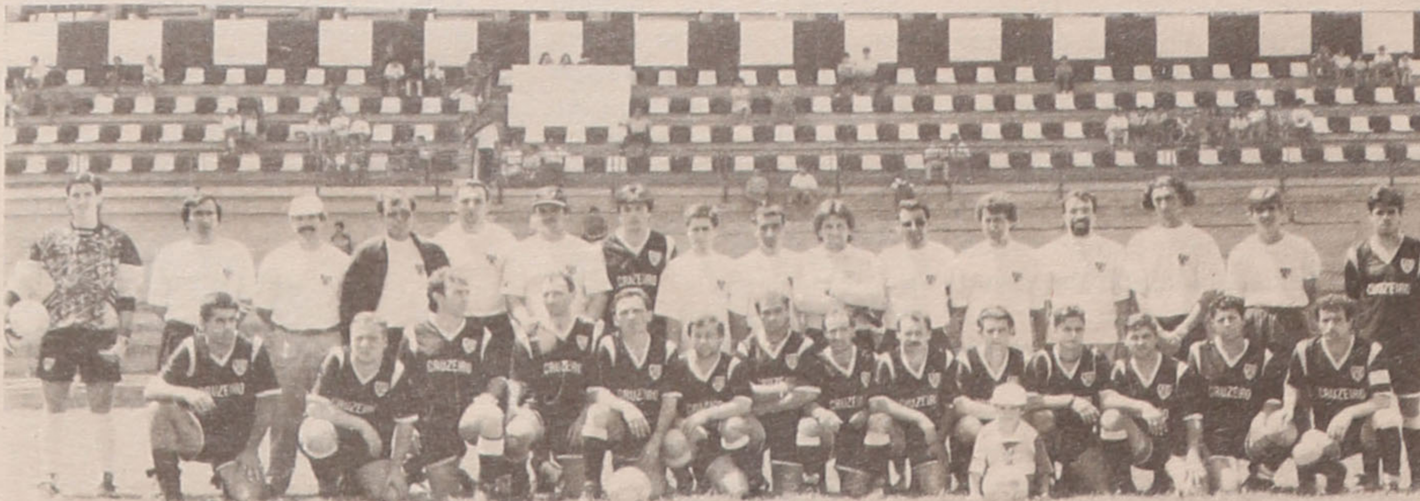
Associação Desportiva do Cruzeiro, clube vencedor do campeonato popular (1.ª divisão) e da Supertaça - época 94/95