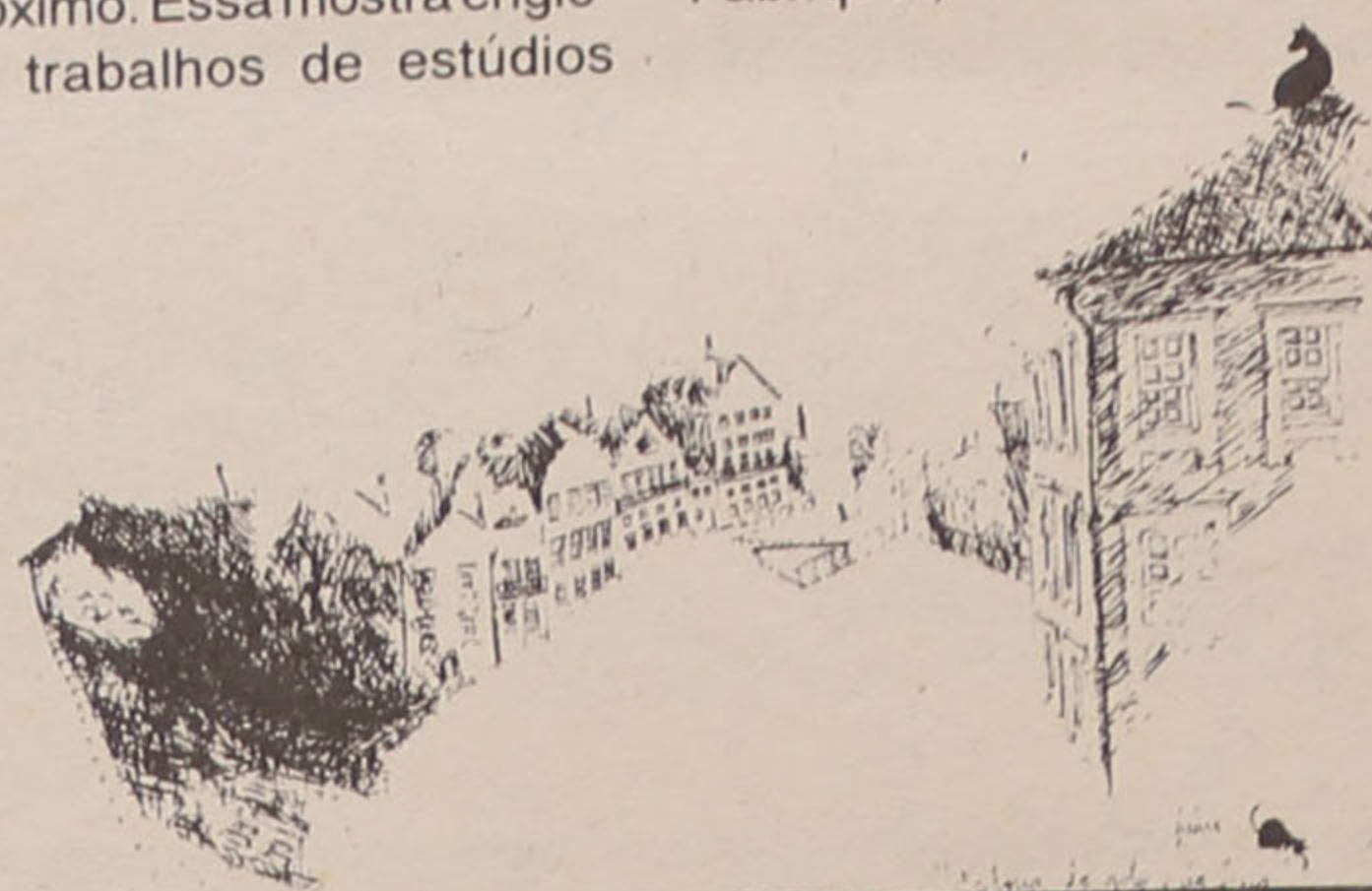
"Estórias do Gato e da Lua", de Pedro Serrazina

De realçar que que o Cartoon D'Or (melhor prémio europeu de cinema de animação), patrocinado pela Cartoon Europeia, será atribuído em Setembro, na Finlândia. Dos cinco finalistas, apontados por um júri constituído para o efeito, dois - "Le Monge et le Poisson" (França) e Rigolito (Reino Unido) - foram escolhidos de entre os premiados do CINANIMA 94.