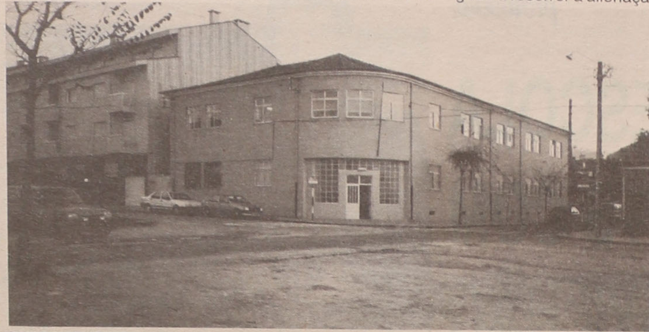
Câmara vai vender terreno da Escola Preparatória Domingos Capela

alienação de património e a revisão do plano e orçamento para o ano em curso.