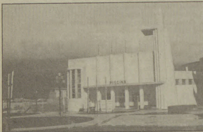
A Teixeira Duarte cumpriu e no dia 10 começou os trabalhos para reconversão da Piscina Solário Atlântico.