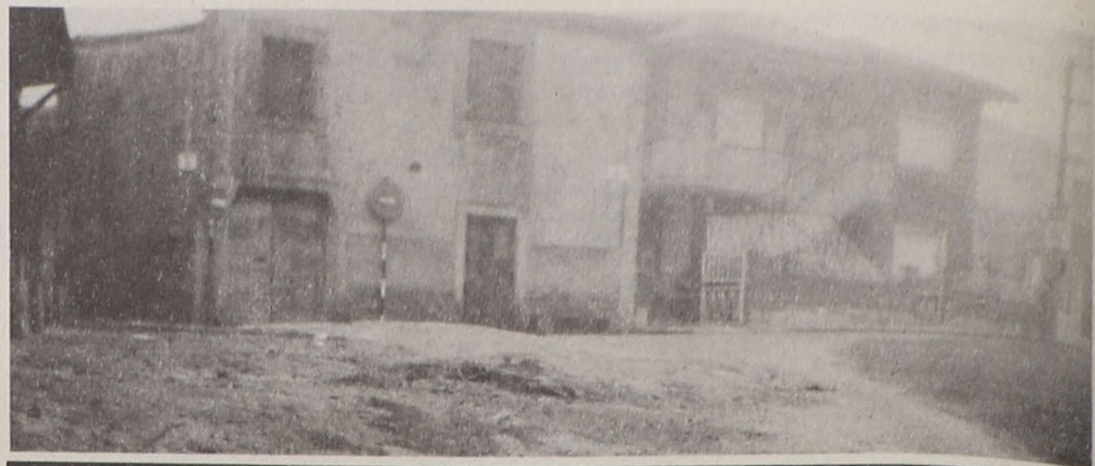
Largo do Souto precisa de arranjo