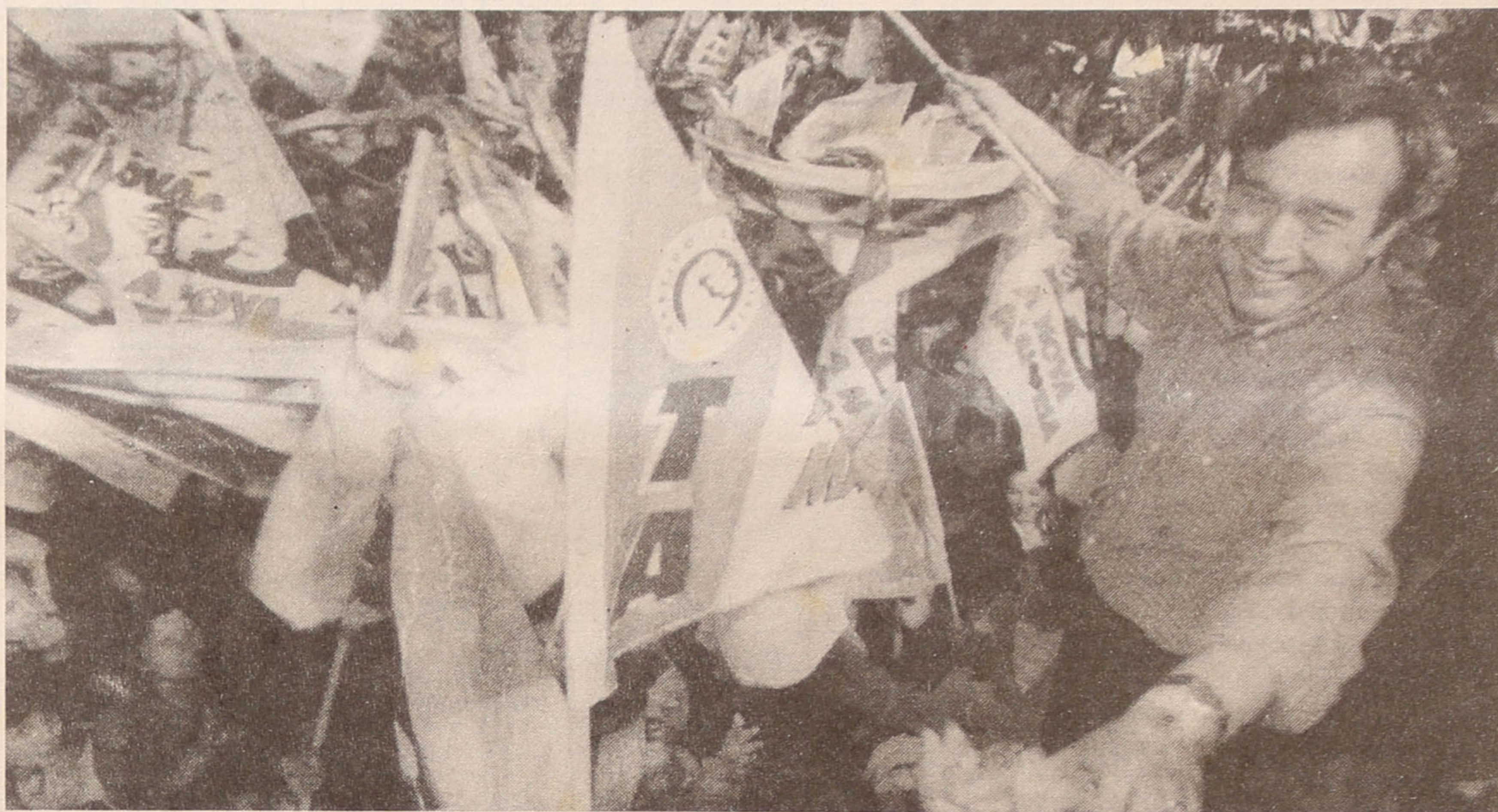
António Guterres é o secretário-geral socialista com melhor resultado eleitoral em vinte anos de eleições