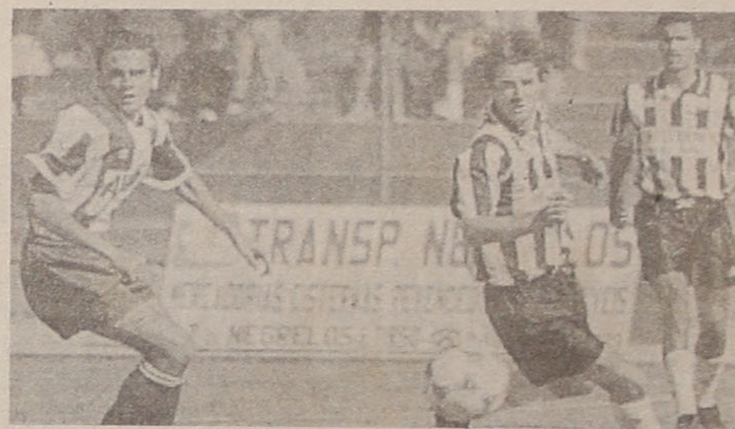
II Divisão de Honra: Aves, 1 - Espinho, 0

Depois de ter visto um golo anulado, decisão merecedora de algumas dúvidas, o Espinho sofreu uma grande penalidade injustificada, pois o avançado do Aves caiu sem que o defensor dos "tigres" cometesse falta. A grande necessidade dos donos da casa em não sofrer nova derrota terá criado um ambiente desfavorável aos visitantes, que se bateram sempre com mais atrevimento.