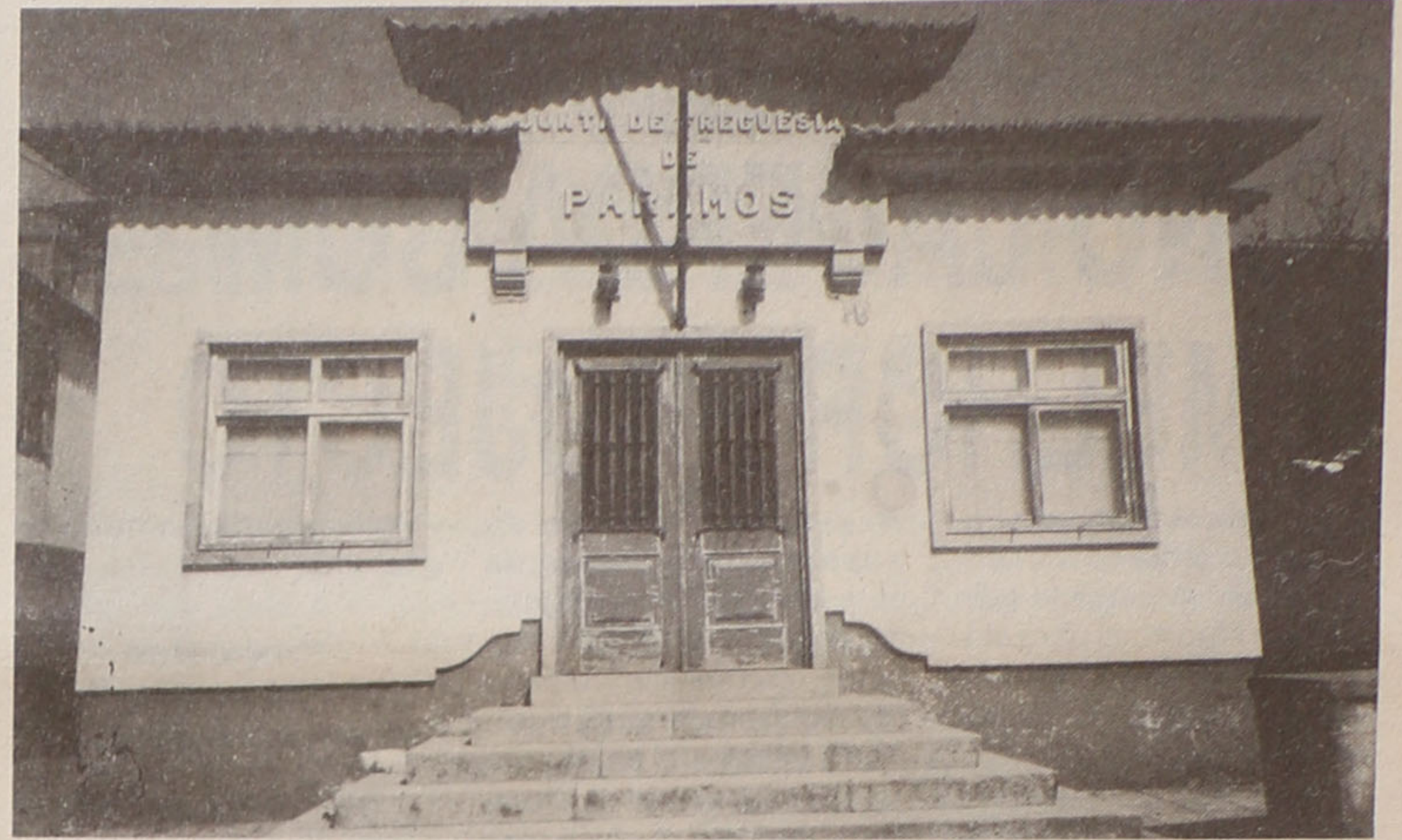
O velho edifício da Junta sempre vai passar a biblioteca