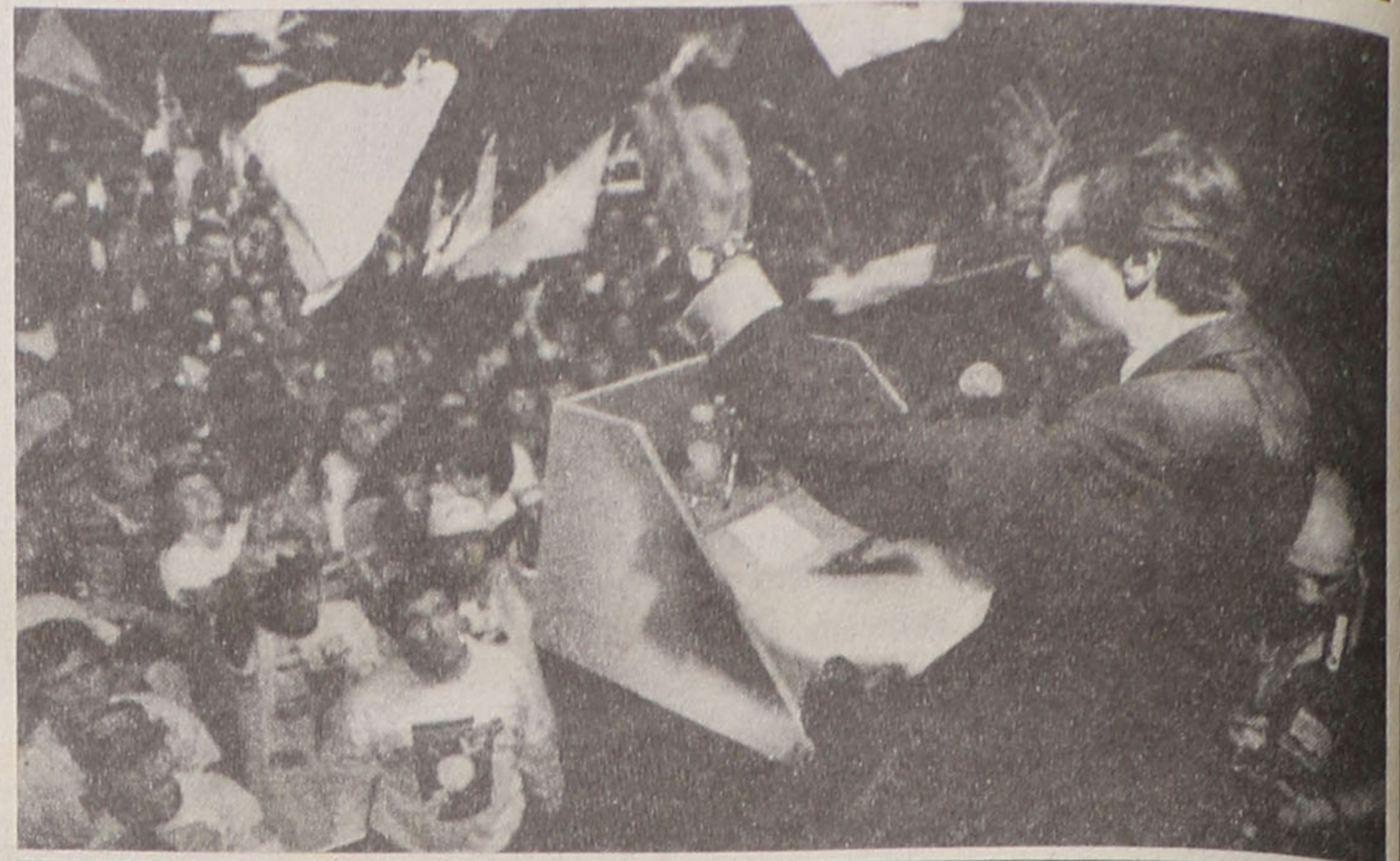
O PP duplica os votos e passa a terceira força do concelho

Finalmente, o lugar aos vencedores. Não há discussão possível ou análise que escape a tais resultados. Ganhou e a sua mensagem, embora clonizada ou, se preferirem, gémea do PSD, tinha um acréscimo de credibilidade que lhes garantiu a confiança do povo português e a ânsia de ver outras caras a defender os mesmos problemas. Plagiando a UDP, só mudaram as moscas. Nos temas centrais da nossa política interna e externa, a mudança irá ser nula. Um dos indicativos dessa realidade é a passividade com que reagiram