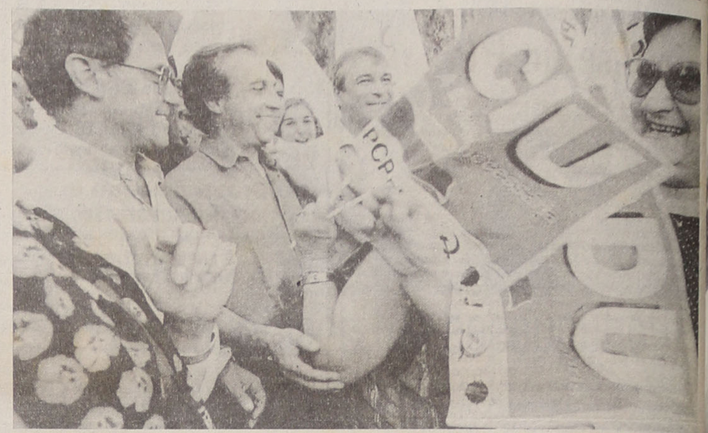
A CDU obtém, em Espinho, o melhor resultado do distrito

os mercados cambiais no "day after" deste combate.