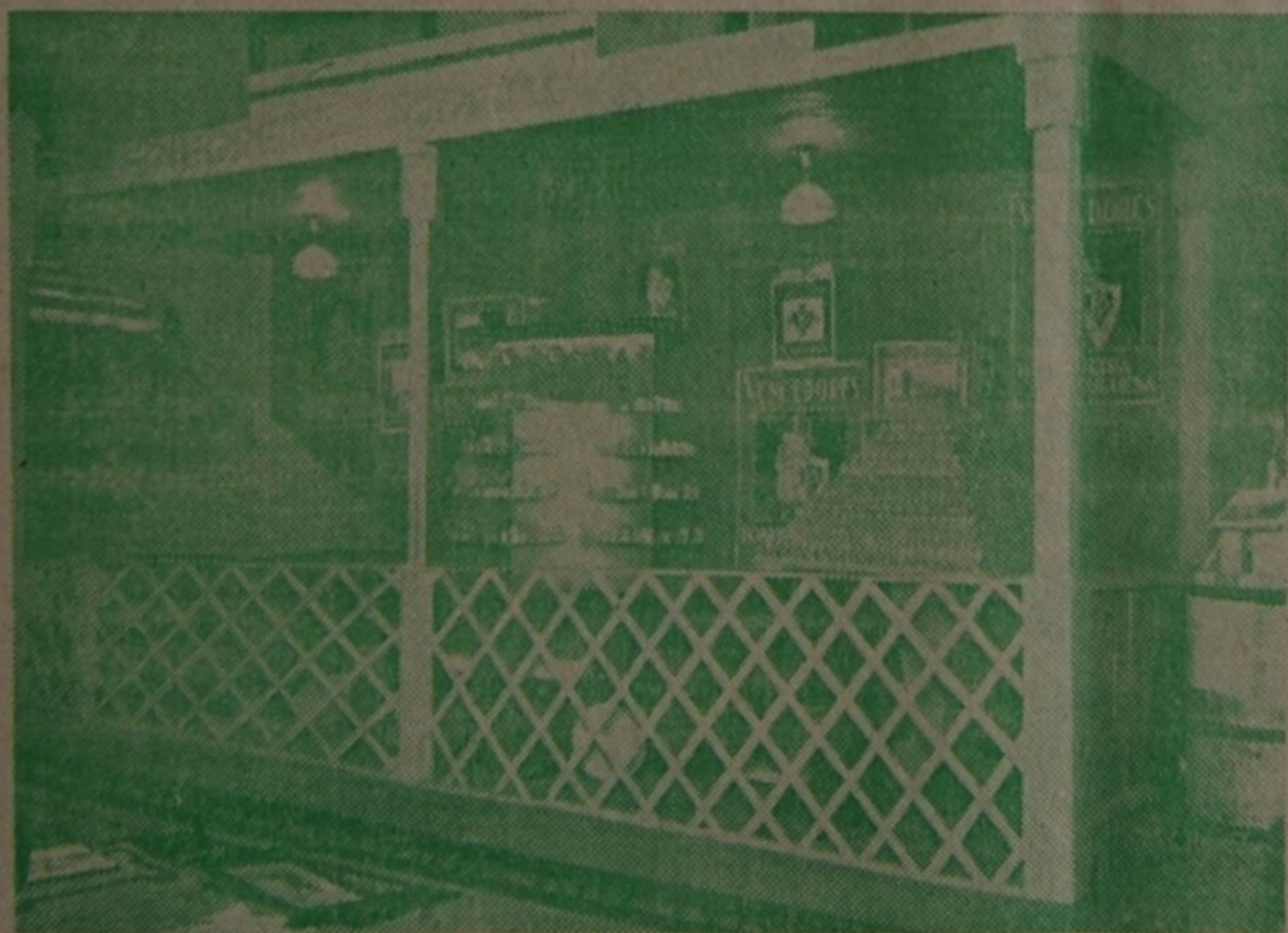
O vistoso STAND de A Fosforeira Portuguesa