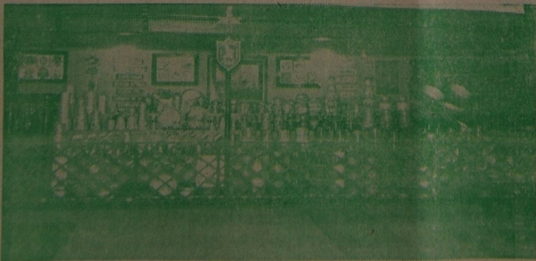
O importante STAND da Fabrica Progresso