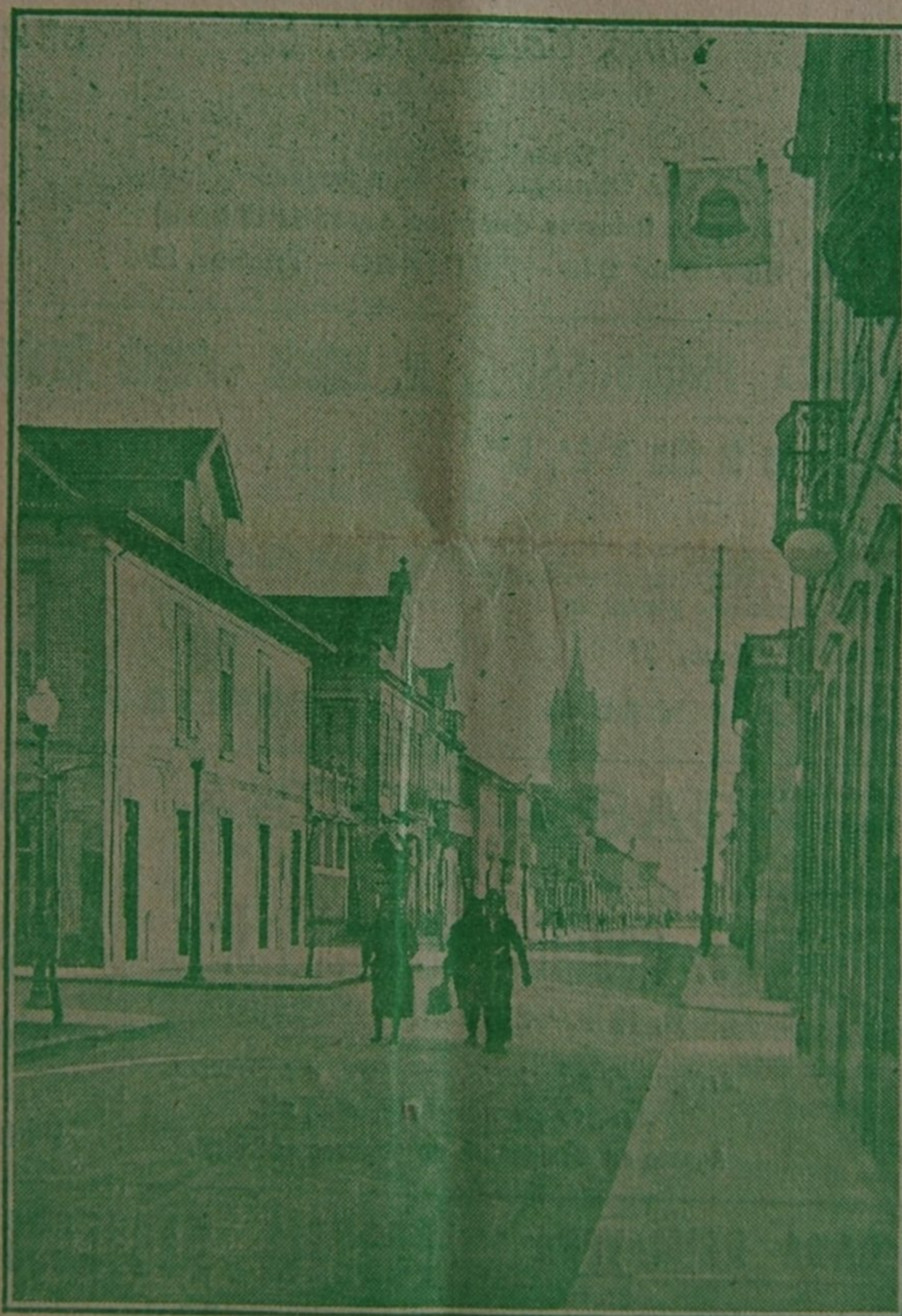
Um trecho da rua 18

Respondam, pois. Atentem no que se acaba de lêr, e, conscientemente, sem faciosismos ou preocupações imbecis, digam-nos:—mentimos?