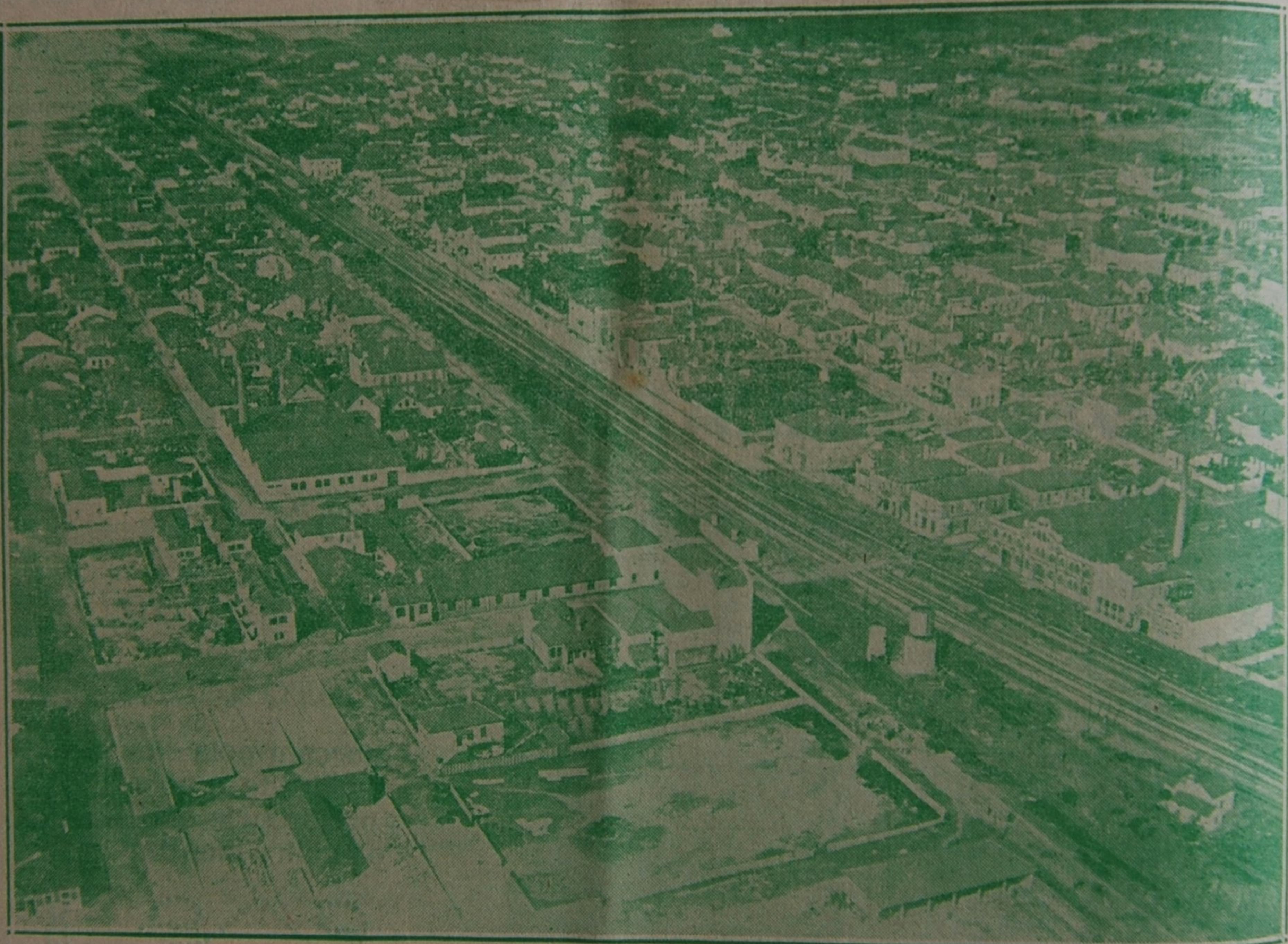
Uma vista parcial de ESPINHO tomada de avião

Uma terra que sofre consecutivas invasões do mar, uma terra que vê destruidos num curto lapso de tempo mais de oitocentos prédios, uma terra que é atravessada por um violento ciclone que ainda hoje —passados oito anos— a todos patenteia a sua infernall acção , uma terra que vê paralizados por momentos, mercê de violentíssimos incendios, algumas parcelas do seu património industrial, reagindo... lutando sempre, não é terra que esteja condenada a desaparecer, que mereça ser esquecida por aqueles que deviam tributar aos que mais trabalham um prémio comemorativo da sua energia, não é terra que deva ser torpedeada no seu legítimo anseio de desenvolvimento e progresso, e não é terra que deva estar sujeita a influências estranhas que nada tem que