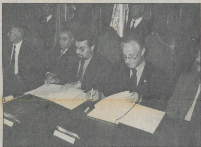
Os presidentes da Câmara e da REFER assinam o protocolo

Todos os presentes à sessão, realizada no Salão Nobre dos Paços do Concelho, se deslocaram a pé até à via férrea para apreciar a passagem dos comboios.