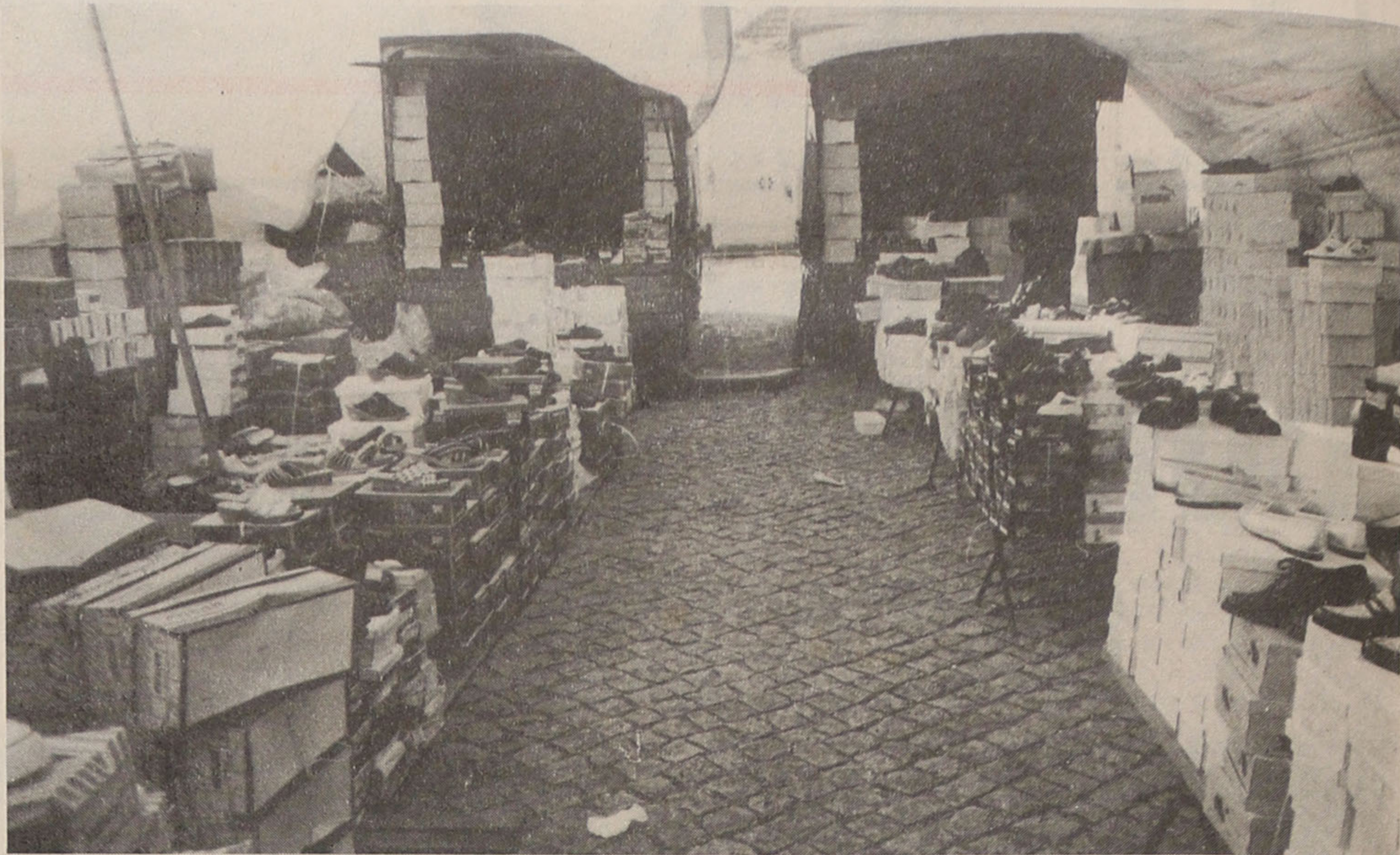
Vendas por grosso ou vendas a retalho?

Tendas e mais tendas, roupas e sapatos em "doses industriais". As cores fortes, a condizer com a entrada da Primavera, chamam a atenção. A alta tecnologia também por lá paira. Deparamos com uma tenda já a fazer as suas transacções com computador instalado. Mais à frente, o "fetichismo" do momento - um vendedor a negociar via telemóvel. Afinal, estamos na era das "aldeias globais"... E se, por acaso, lhe apetecer comer uma fartura, uma bifana, ou tomar, por exemplo, um sumo, tem à sua disposição variadas roulotas. E, mais ainda, se ainda não comprou os alimentos para confeccionar o seu almoço, pode fazê-lo no momento - é o peixe do nosso mar a ser apregoado e vendido pelas nossas vareiras. Descrições e divagações à parte, vamos à conversa com vendedores e compradores da feira da revenda.