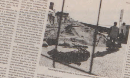
Associação cívica para mudar a face do concelho sem perder a identidade.

Um jantar com uma ementa muito especial: encontrar o nome e avançar nos estatutos de uma associação que mesmo sem padrinhos já dá que falar. Já há quem receie indigestões.