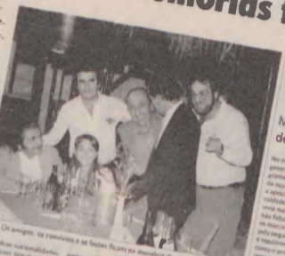
Momentos de aflição

Durante décadas, muitos espinhenses viram na Venezuela um país de onde regressariam ricos e realizados. As memórias são felizes, mas os regressos vão-se sucedendo impulsionados pela instabilidade que por lá se vive.