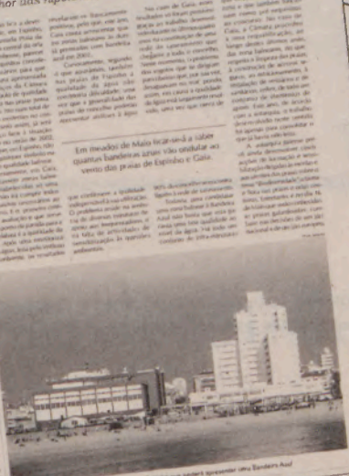
Prós do Balc é a única em Espinho que poderá apresentar uma Bandeira Azul.

Enquanto a Câmara de Gaia espera colocar à disposição dos frequentadores das suas zonas balneares nada menos de 16 praias com bandeira azul, em Espinho isso só acontecerá, na melhor das hipóteses, numa única praia.